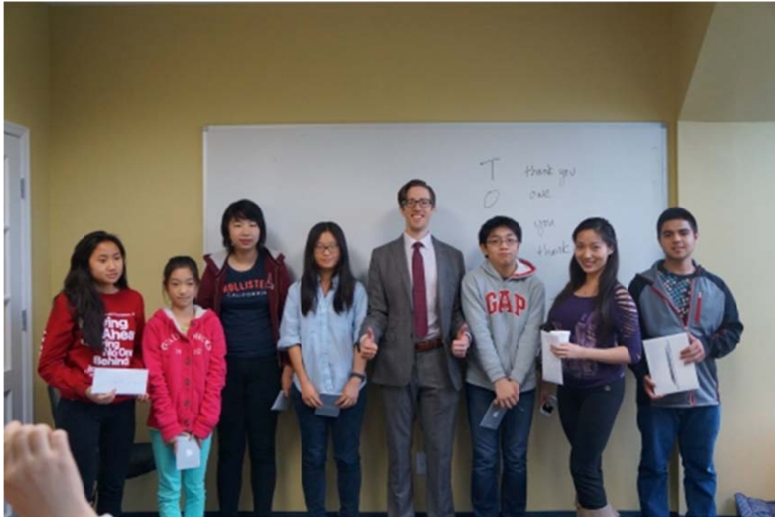
图为优质教育中心纽约市法拉盛校区青少年卡内基训练营