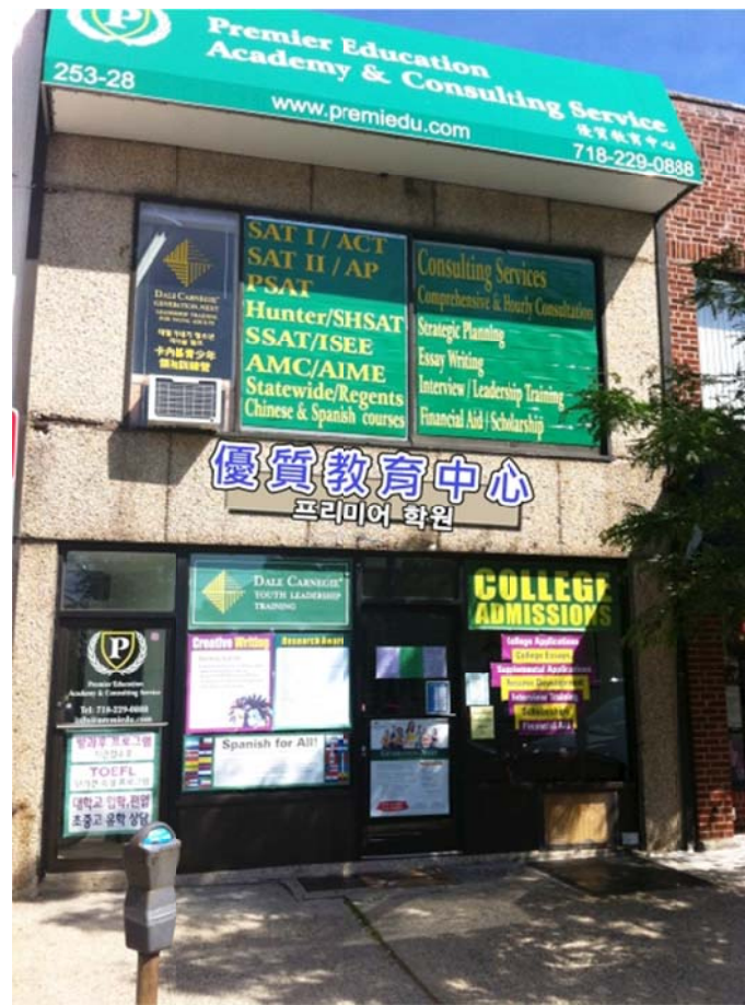
(图为优质教育中心纽约市皇后区小颈校区)

另外，我们的目标是提供超越学科教育的服务。我们提供的是提高学生起跑线的独特项目，这些新奇的项目使学生感受到丰富的新体验。