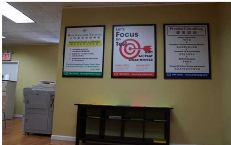
图为优质教育中心纽约市法拉盛校区