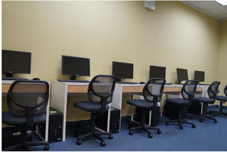
图为优质教育中心纽约市法拉盛校区